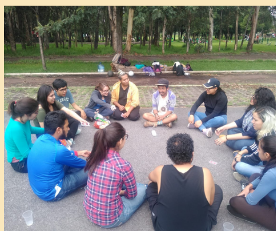
Becarios del CCIUDADANO en actividad de integración.

Con esta motivación, en el año 2019 participamos en el PJCF .