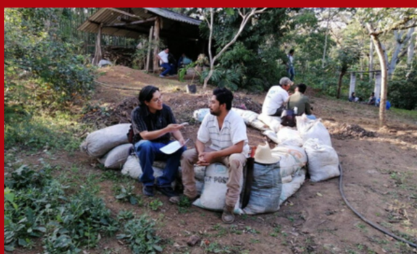
Entrevista a tutor en la comunidad de Cosautlán, Veracruz.