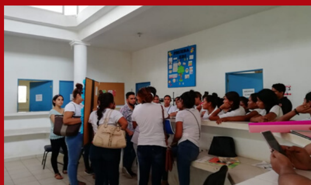
Becarios del Centro de Salud de Cuatepec, Guerrero.

En CCIUDADANO realizamos un trabajo de investigación sobre el Programa, con un equipo que incluyó becarios. En seis meses, hicimos trabajo de campo y gabinete en centros de capacitación de la ciudad de México y los estados de Guerrero y Veracruz. Producto de este ejercicio elaboramos propuestas de mejora a la normativa y la estructura del Programa.